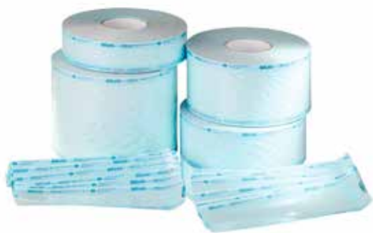
Упаковка MELAfo!® поставляется в рулонах и пачках.

Эффективный способ избежать загрязнения простерилизованных инструментов – запечатать их в упаковку для стерилизации MELAfo!®. Упаковка MELAfo!® представляет собой сочетание бумаги и прозрачной пленки. Такая упаковка герметична для микробов, устойчива к износу и легко открывается. MELAfo!® соответствует стандарту DIN EN 868-5.